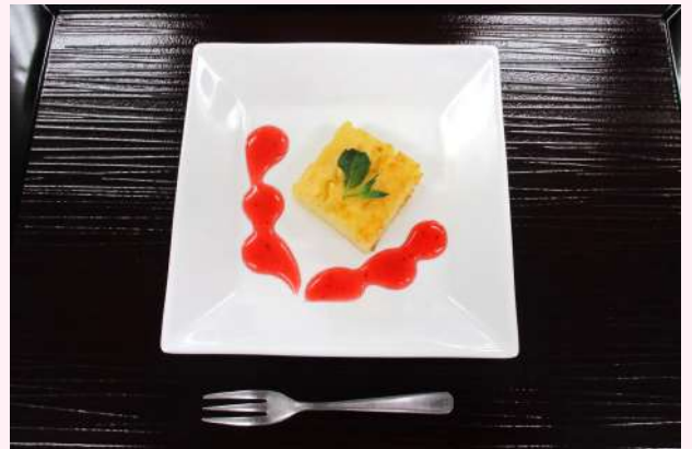
ヨーグルトチーズケーキ 苺ソース