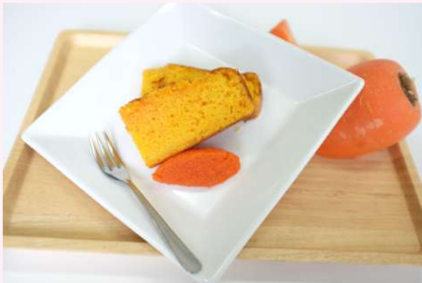
キャロットケーキ

3月24日のデザートパラダイスは、とても盛大に行なわれました。厨房スタッフが手作りした美味しいデザート12品を、一口ずつ器にキレイに盛り付けて、目に楽しい、口に美味しい、心ウキウキの楽しいひと時でした。