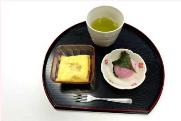
苺クレープと包み桜餅