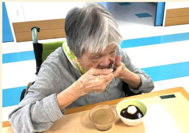
利用者さんのおやつはぜんざいでした。お餅はお粥のゼリーを使用しています。