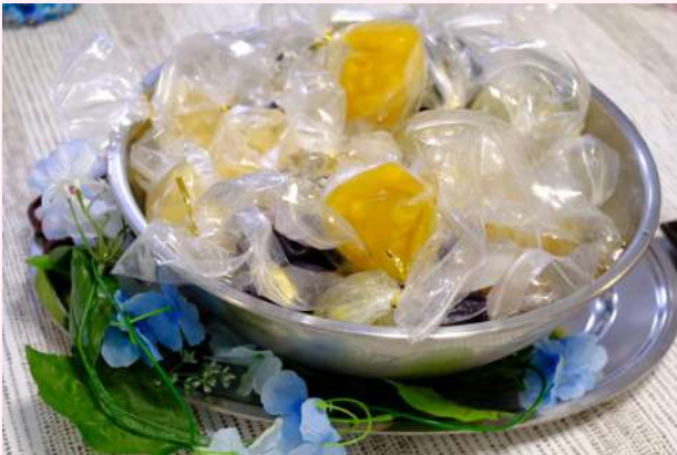
ショートステイ おもてなし彩りゼリー

6月。梅雨でジメジメ。外になかなか出られない。そんな時こそ、おいしい物を食べてみんなで楽しみましょう！！とすることで、6月のヴィラ都筑ではデザートイベントがたくさんありました。さあ、召し上がれ♪