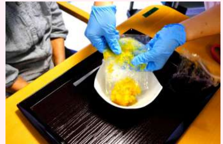
目の前で出します！