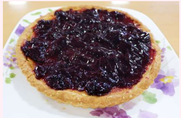
アメリカンチェリーパイ