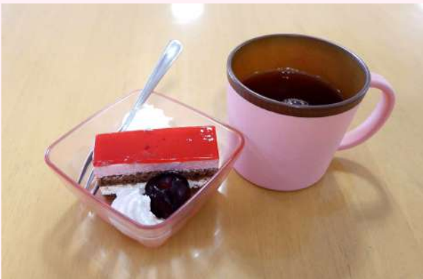
さくらんぼケーキ