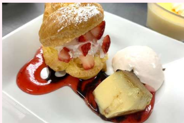
シュークリームアラモード

苺味と抹茶味のクッキー生地を丸めてボール状にしました。 白いメレンゲを添えてカラフルでかわいらしく仕上げました。