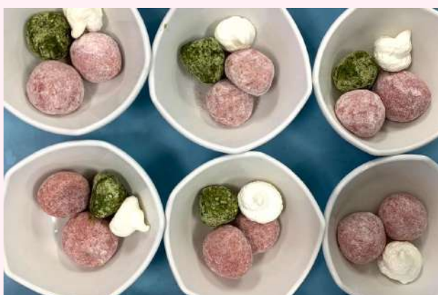
スノーボールクッキー

タルト生地にクレームダマンドを敷き、その上にカスタードクリームを搾りました。 ツヤツヤの苺を飾りつけ！