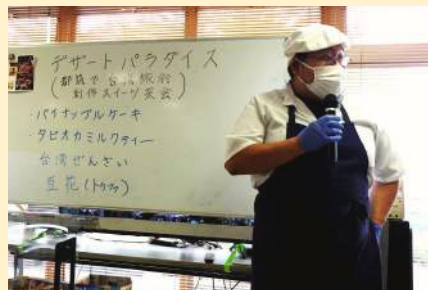
デザートパラダイスのメ ニューの紹介をしています。