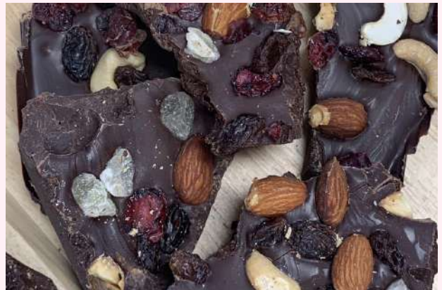
カカオ51%タブレットチョコ (マンディアン)