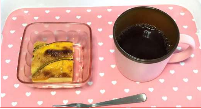
カボチャのクラフティ