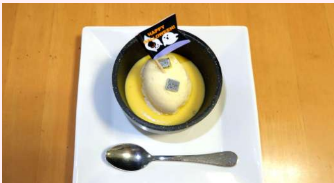
カボチャの冷製スープバニラアイスのせ