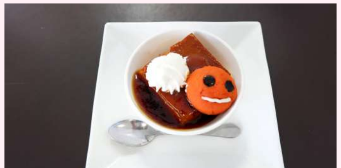
<入所> ジャックランタンプリン